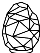
Barry Hill XL 10-14 кг до 120м 2